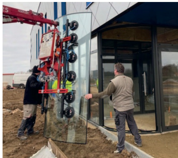
Version DSLMH2 Verre Bombé.

Reprenant les fonctions de la commande à câble, un récepteur est monté directement sur le palonnier afin d'assurer une liaison à distance sans câble.