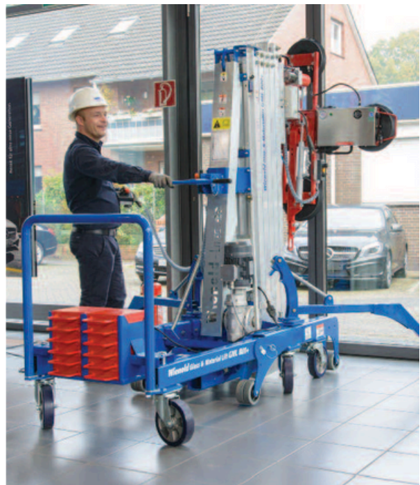
GML800+ Pose de marquise