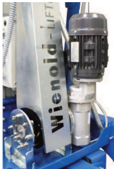
GML800+ monté électrique