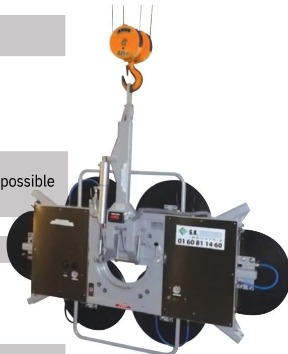
Palonnier DSZ2 Goliath (option)

Accessoire Rallonge de stabilité Standard Support de stockage